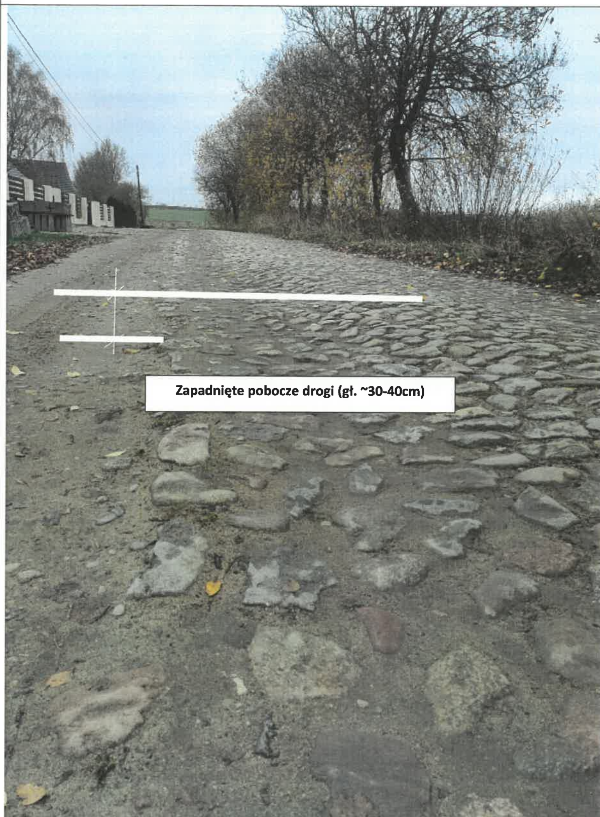
Zapadnięte pobocze drogi (gł. ~30-40cm)